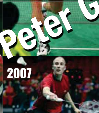
Vainqueur des Singapore Open - image de la Thomas Cup à Tokyo.