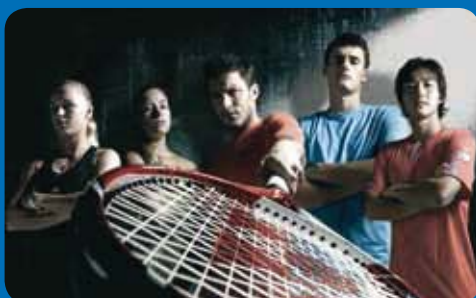
Les raquettes de tennis VCORE Xi sont arrivées récemment en Suisse, et sont présentées ici par Caroline Wozniacki, Angélique Kerber, Juan Monaco, Bernard Tomic et Go Soeda.