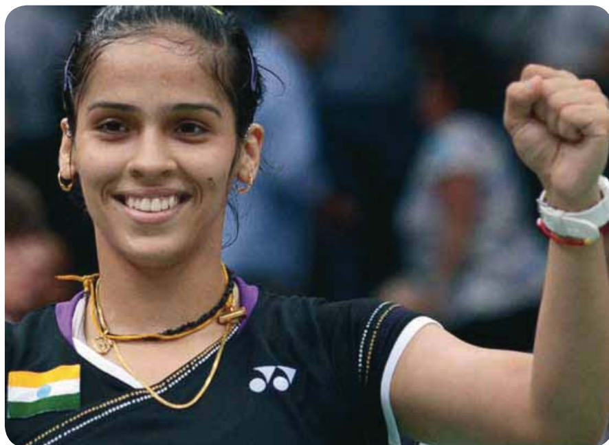
Une star que l'Inde a attendue: la joueuse de badminton Saina Nehwal, numéro 3 mondiale et médaillée de bronze à Londres en 2012.

L'Inde n'a gagné que 26 misérables médailles depuis les premiers Jeux Olympiques modernes, dont neuf en or et toutes lors des Jeux d'été. En comparaison: la Suisse, qui a cent-cinquante fois moins d'habitants que l'Inde, en a gagné 312. L'Inde a un grand soif de stars dans le domaine du sport. Les sportifs les plus populaires sont les joueurs de Cricket et les hockeyeurs sur gazon, tous des hommes. Mais maintenant arrive une jeune femme qui gagne de grands tournois, les uns après les autres, et même contre les Chinoises pourtant très puissantes en apparence. Magnifique!