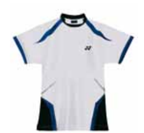
Polo-Shirt Salma XS-XL Fr. 69.-