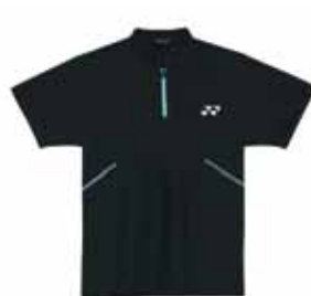
Polo-Shirt Marius XS-XL Fr. 69.-