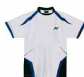
Polo-Shirt Rasmus XS-XL Fr. 69.-