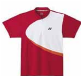
Polo-Shirt M1163 XS-XL Fr. 69.-