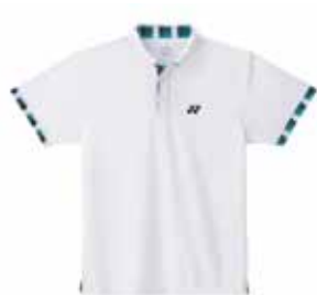
Polo-Shirt M1120W XS-XL Fr. 69.-