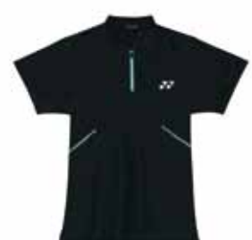
Polo-Shirt Malene XS-XL Fr. 69.-