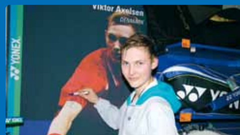
Viktor Axelsen anlässlich der Autogrammstunde am Yonex-Stand. Der 19jährige ehemalige Juniorenweltmeister ist besonders beliebt beim jüngeren Publikum.