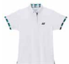
Polo-Shirt L2120W XS-XL Fr. 69.-