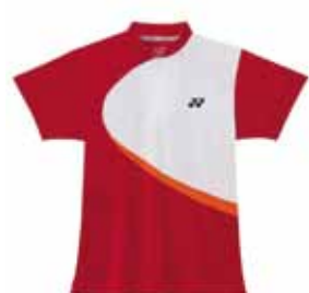
Polo-Shirt L1163 XS-XL Fr. 69.-