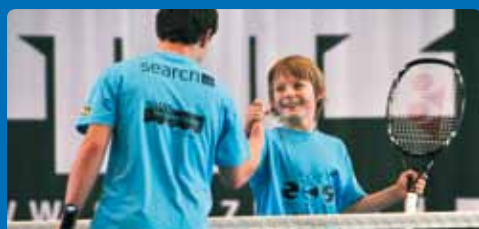
Der ehemalige Fussballprofi Mario Sager macht tolle Sportcamps mit Kids in der ganzen Schweiz. Yonex unterstützt dabei die Tenniscamps.