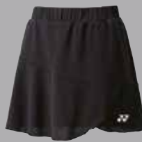
Skort 26027 schwarz Fr. 59.-