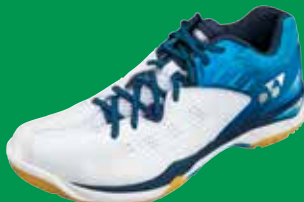
SHB CFT zweifellos zuverlässig, angenehm bequem Fr. 179.-