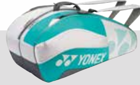
BAG 8526 Fr. 99.-