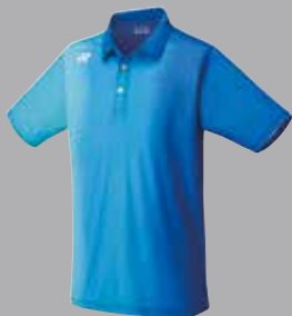
Shirt 12129 blau Fr. 89.-