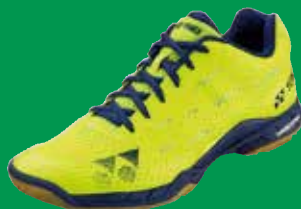
SHB AERUS MEN neu, nahtlos, leicht und locker Fr. 189.-