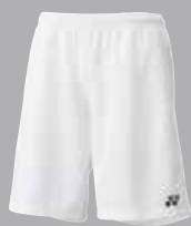
Shorts 15038 weiss Fr. 49.-