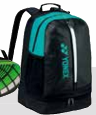
BAG 1618 Rucksack Fr. 79.-