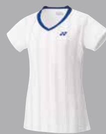
Shirt 20303 weiss Fr. 69.-