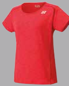
Shirt 20289 rot Fr. 69.-