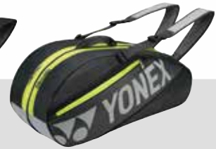
BAG 7626 dunkelgrau Fr. 89.-