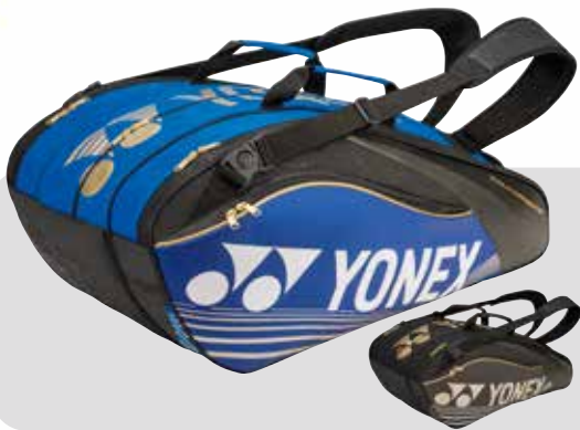
BAG 9629 blau o. schwarz Fr. 139.-