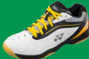
SHB 65R robust, resistent, phänomenal preiswert Fr. 119.-