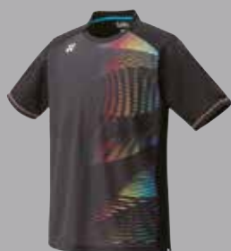
Shirt 12130 schwarz Fr. 69.-