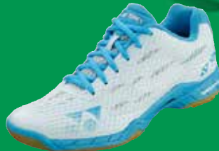
SHB AERUS LADIES neu, nahtlos, leicht und locker Fr. 189.-