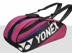
BAG 7626 Plum Fr. 89.-