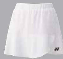
Skort 26027 weiss Fr. 59.-