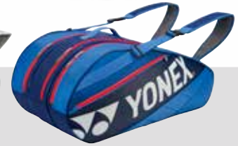
BAG 7629 Fr. 99.-