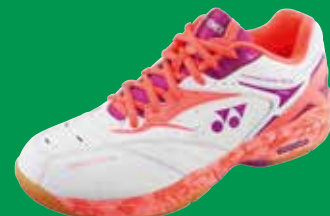
SHB SC5LX kompakt, komfortabel, bereits bewährt Fr. 129.-