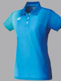
Shirt 20298 blau Fr. 89.-

Diese Aufstellung ist nicht komplett. Für weitere Produkte siehe www.yonex.ch .