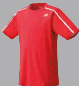
Shirt 10149 rot Fr. 69.-