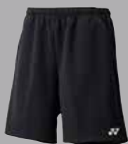
Shorts 15038 schwarz Fr. 49.-