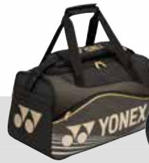
BAG 9631 Boston Bag Fr. 89.-