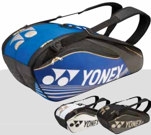
BAG 9626 blau o. weiss o. schwarz Fr. 119.-