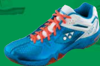
SHB 02MX enorm erprobt, sicher und stabil Fr. 169.-