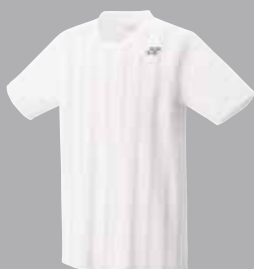
Shirt 12134 weiss Fr. 69.-