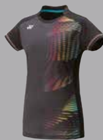
Shirt 20299 schwarz Fr. 69.-