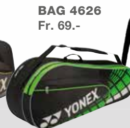
BAG 4626 Fr. 69.-