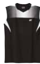
Polo-Shirt 12077 Fr. 69.- (empf. VP)