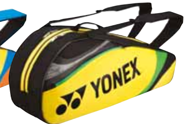
BAG7326 Gelb Fr. 99.-