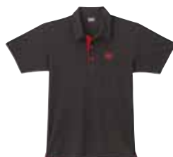
Polo-Shirt M1401 Fr. 69.- (empf. VP)