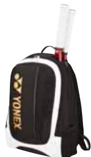
BAG7312 Schwarz&Gold Fr. 69.-