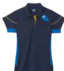
Polo-Shirt L2453 Fr. 69.- (empf. VP)