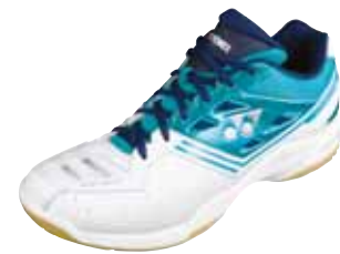
SHB F1 Neo MX Fr. 179.-