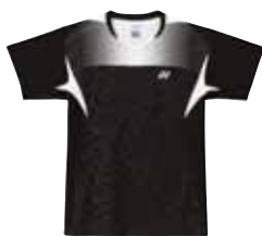
Polo-Shirt 12075 Fr. 89.- (empf. VP)