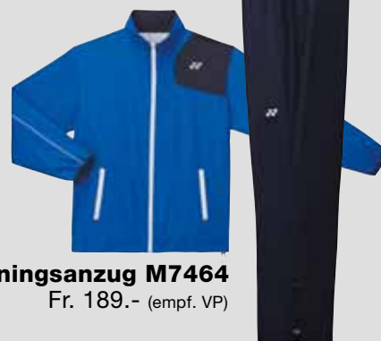
Trainingsanzug M7464 Fr. 189.- (empf. VP)