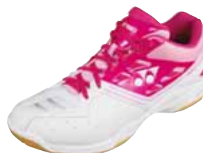
SHB F1 Neo LX Fr. 179.-