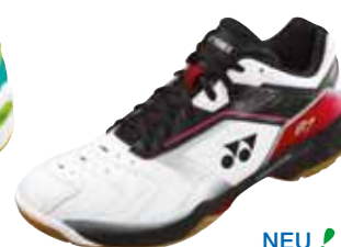
NEU! SHB 87 EX Fr. 139.-