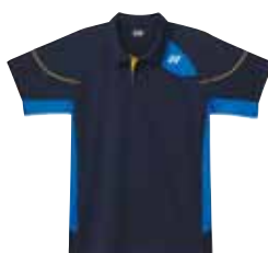
Polo-Shirt M1453 Fr. 69.- (empf. VP)