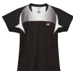
Polo-Shirt 20199 Fr. 89.- (empf. VP)