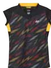
Polo-Shirt 20200 Fr. 89.- (empf. VP)