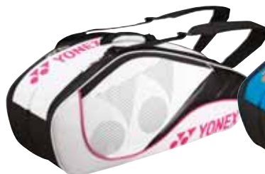
BAG8426 Weiss Fr. 99.-