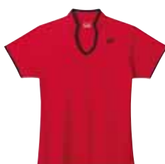
Polo-Shirt L2402 Fr. 69.- (empf. VP)