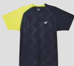
T-Shirt M5423 Fr. 49.- (empf. VP)