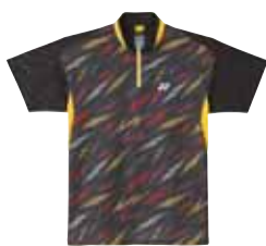
Polo-Shirt 12078 Fr. 89.- (empf. VP)