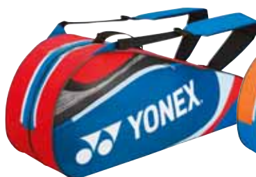
BAG7326 Blau&Rot Fr. 99.-