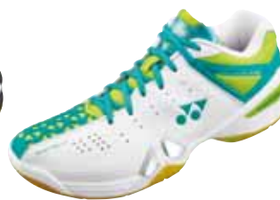
SHB 01 LX Fr. 189.-