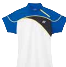
Polo-Shirt L2474 Fr. 69.- (empf. VP)