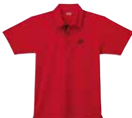
Polo-Shirt M1402 Fr. 69.- (empf. VP)