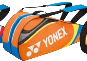
BAG7326 Orange Fr. 99.-