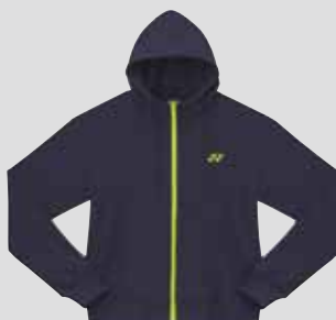
Hoodie U6433 Fr. 99.- (empf. VP)