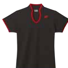
Polo-Shirt L2401 Fr. 69.- (empf. VP)