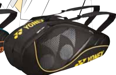
BAG8426 Schwarz Fr. 99.-