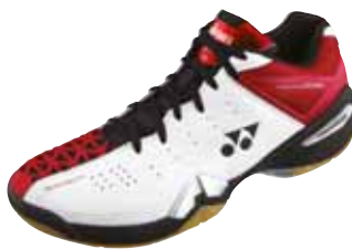
SHB 01 MX Fr. 189.-