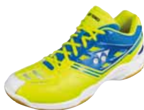
SHB F1 Neo LTD Fr. 199.-