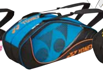
BAG8426 Türkis Fr. 99.-